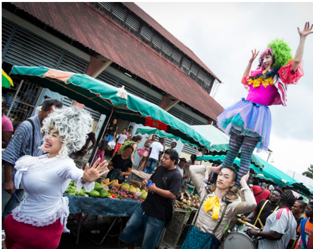
▲ Parade de la Compagnie japonaise to R Mansion Festival Les Tréteaux du Maroni 2014

La mise en place de partenariats avec les acteurs culturels de la Grande Région et d'Europe - afin de créer un mouvement de coopération fort entre la Caraïbe, l'Amérique latine et le continent européen - font de Saint Laurent du Maroni et de la Guyane la tête de pont de ces nouveaux réseaux.