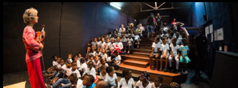
▲ La Case Théâtre n°8

Grâce au soutien de la Mairie de Saint-Laurent du Maroni, du programme Leader et du Ministère de la culture - Dac Guyane, la Compagnie KS and CO, sous la maîtrise d'ouvrage de Serge Abatucci, met en place les infrastructures du centre dramatique Kokolampoe telles qu'elles existent aujourd'hui.