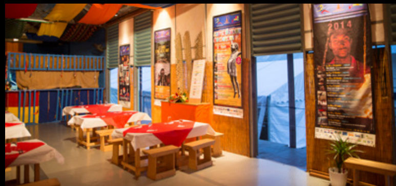
▲ La Case n°4 - Koko Resto et l'espace Billetterie