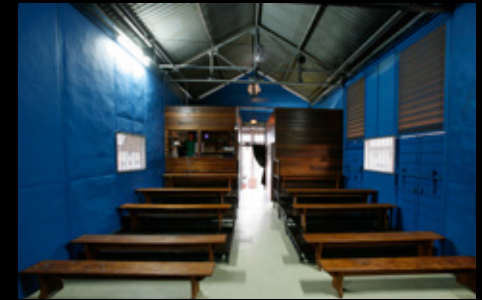
▲ Espace public de la Case Théâtre n°8 de 2006 à 2012