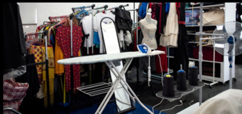
▲ La Case n°9 - La costumerie