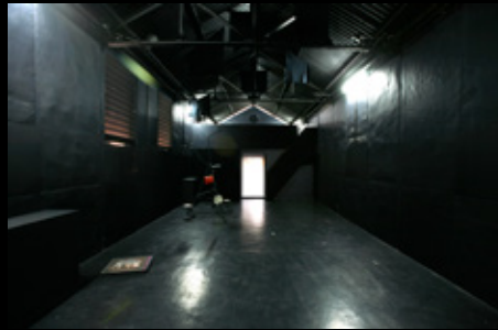
▲ Espace scénique de la Case Théâtre n°8 de 2006 à 2012

Installée depuis 2004 dans les cases n°8 et 9 du Camp de la Transportation, la Compagnie KS and CO a mis en œuvre son projet de développement des activités théâtrales tout en aménageant et animant progressivement des espaces patrimoniaux : les cases du Camp de la Transportation.