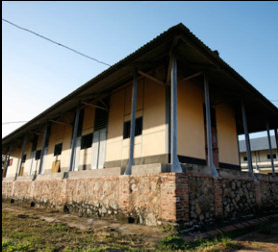
▲ Une case simple vue de l'extérieur (Case n°9)