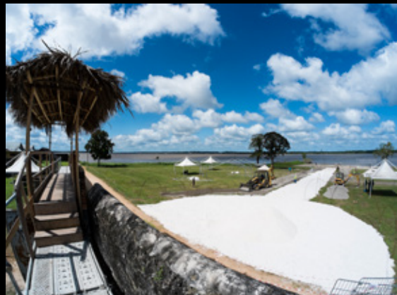
▲ La Roche Bleue entre le Camp et le Maroni Une Iliade

Espaces de performances et de rencontres, Théâtre de verdure