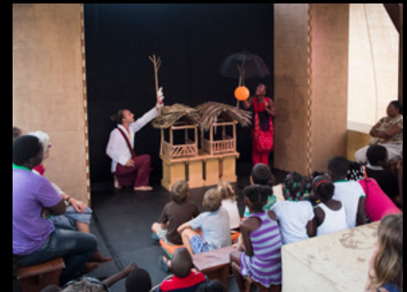
▲ Lavoir Les voleurs de soleil