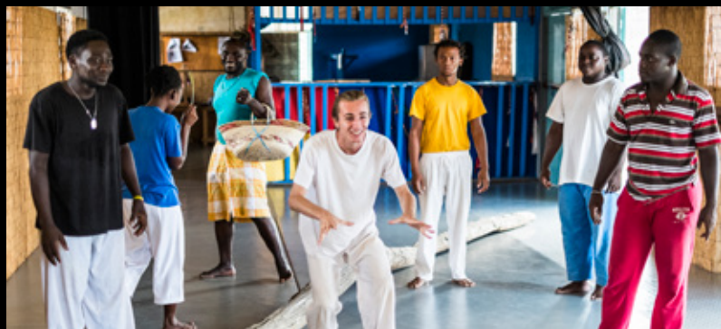
▲ La Case n°4 - La Formation des comédiens